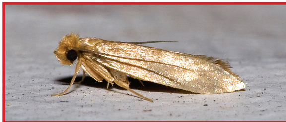
Polilla de la ropa ( Tineola bisselliella )